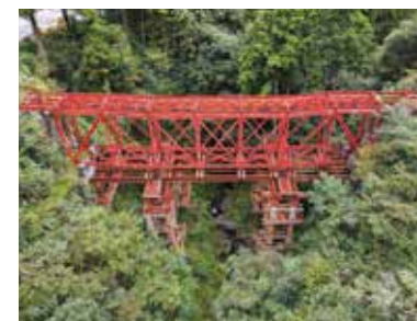
犬吠橋 国指定重要文化財

大正15年(1926)に建造された橋長12.3メートルの鋼製の桁橋です。高知県道として利用されています。