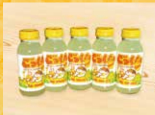
ごっくん馬路村 (馬路村農業協同組合)