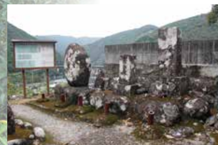
中岡慎太郎遺髪埋葬墓地 北川村指定史跡

ゆず栽培を奨励した中岡慎太郎の生誕地に生家が復元されています。近くに、博物館「中岡慎太郎館」があります。