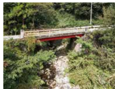
釜ヶ谷橋 国指定重要文化財

昭和15年(1940)年に建造された橋長46.5メートルのコンクリート造の二連アーチ橋です。高知県道として利用されています。