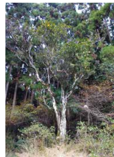
柚子の古木 北川村指定天然記念物

ゆず栽培を奨励した北川村出身の中岡慎太郎の顕彰と、ゆずの収穫を祝う祭です。北川村で毎年10月末もしくは11月初めに開催されます。