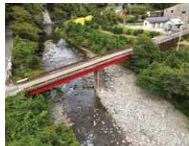
落合橋 国指定重要文化財

昭和7年(1932)に建造された橋長143メートルの鋼製の二連トラス桁と五連桁のつながった橋です。北川村道として利用されています。