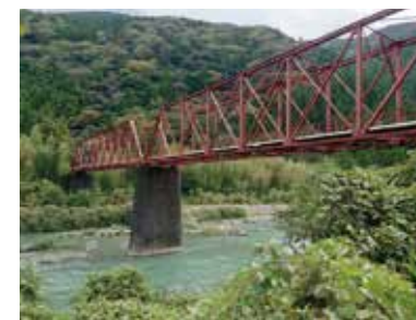
小島橋 国指定重要文化財

大正13年(1924)に建造された橋長41メートルの鋼製のトラス桁橋です。高知県道ですが、破損により2026年2月現在通行止めとなっています。