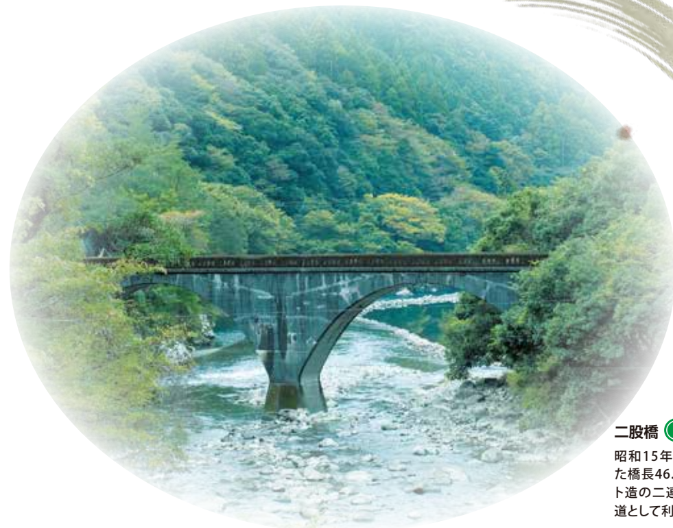
二股橋 国指定重要文化財

昭和4年(1929)に建造された橋長43.2メートルの鋼製のトラス桁橋です。安田町道として利用されています。