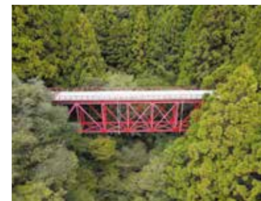
井ノ谷橋 国指定重要文化財

大正14年(1925)に建造された橋長37メートルの鋼製の二連桁橋です。馬路村道として利用されています。