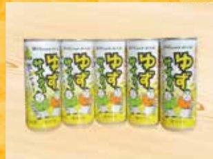
北川村ゆずサイダー (北川村ゆず王国株式会社)